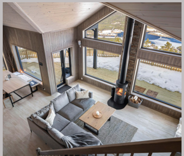
Das helle Eiche-Dekor der Parador-Landhausdielen wirkt betont nordisch und harmoniert perfekt mit der Innenarchitektur des Hauses.

„Bei der Auswahl des Bodens war es mir wichtig, dass der Boden robust und pflegeleicht ist und gut mit Wasser zurechtkommt. Bei den großen Mengen an Schnee, die hier im Jahr fallen, ist das unerlässlich“, sagt der Frankfurter. Zugleich sollte der Boden zur natürlichen Atmosphäre des Hauses passen, Wärme und Ruhe ausstrahlen. So fiel die Wahl auf das helle Dekor „Eiche nordic beige“ in zeitgemäßer Rohholz-Optik.