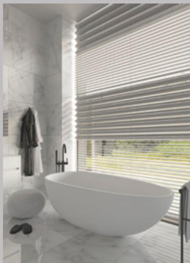
„Slides“ mit wasserabweisenden Lamellen – ein modernes Lichtspiel auch für das Bad.

System ist nicht nur an fixer Position montierbar, sondern auch als seitlich verschiebbare Variante erhältlich.